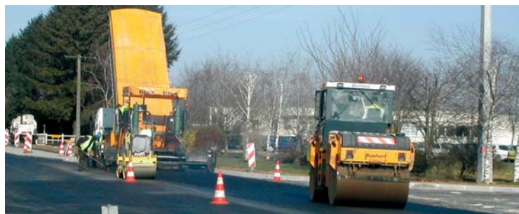
Travaux à Venours (86)

Les travaux réalisés sont essentiellement des travaux neufs (71%), et dans une moindre mesure (29%), des travaux d'amélioration ou d'entretien.