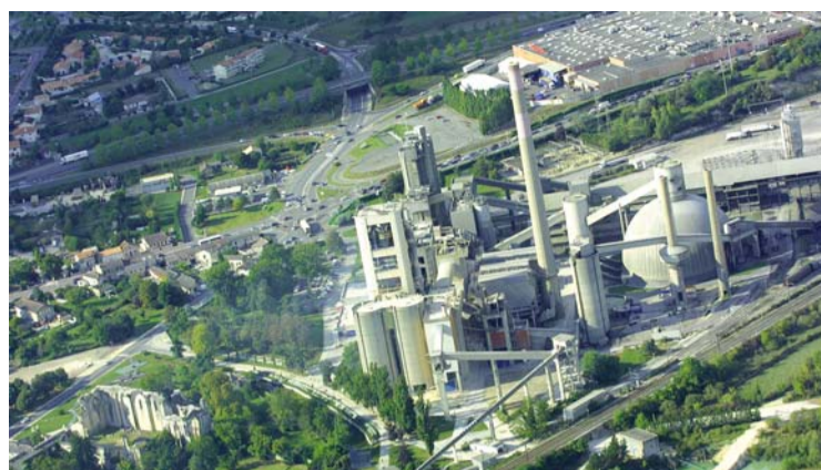
Parc d'activités Euratlantique

Le CETRAM (Centre européen de technologies et de recherche en acoustique et