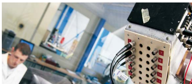
Machine à essais - Emitech