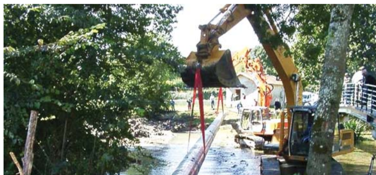
Travaux à Verteuil (16)

Un levier économique important, surtout en Charente et Vienne, départements directement concernés par le passage de cette ligne.