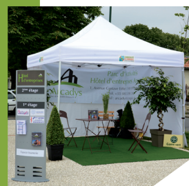
>>> Le stand de promotion d'Arcadys